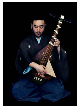
薩摩琵琶奏者 <友吉鶴心>